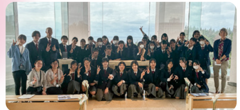
テーブルマナー実習

マリンスポーツ実習では、ダイビングやシュノーケリング、バナナボート体験し、海で楽しむためには安全がとても大切だということを学びました。酸素ボンベやフィンを使う実習では、簡単そうに見えても慣れるまでは意外と大変だと感じ、バナナボートでは人に楽しんでもらう工夫の大切さに気づきました。海の魅力と学びが詰まった貴重な時間になりました。