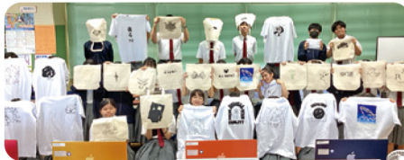
シルクスクリーン印刷