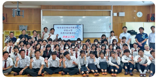
県立岐阜商業高校交流会