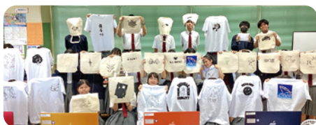
シルクスクリーン印刷