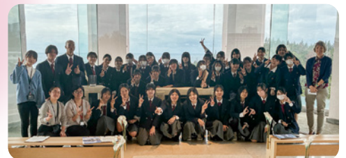
テーブルマナー実習

マリンスポーツ実習では、ダイビングやシュノーケリング、バナナボート体験し、海で楽しむためには安全がとても大切だということを学びました。酸素ボンベやフィンを使う実習では、簡単そうに見えても慣れるまでは意外と大変だと感じ、バナナボートでは人に楽しんでもらう工夫の大切さに気づきました。海の魅力と学びが詰まった貴重な時間になりました。