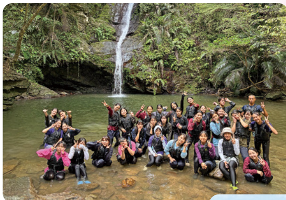
エコツーリズム実習

海外研修では、観光の楽しさと言葉の大切さ、そして人を思いやる心を学びました。現地の方々はとても親切で、日本語で助けてもらったことで安心して観光できました。街でも優しさに触れる場面が多く、思いやりは国を越えて伝わるものだと実感しました。この経験を生かし、私も身近な人を大切にしながら、もっと言語を学んで成長したいと思います。