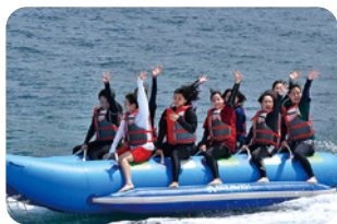
マリンスポーツ実習