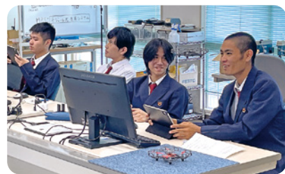
農商工連携プログラム