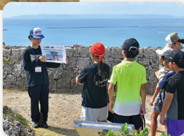
勝連城跡ガイド実習