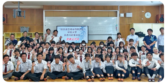
県立岐阜商業高校交流会